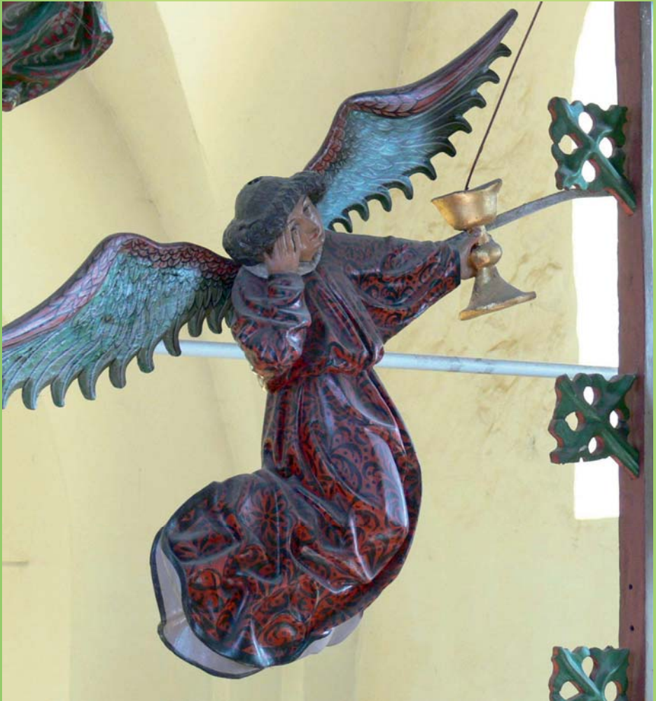
Linker unterer Engel an unserem Triumphkreuz