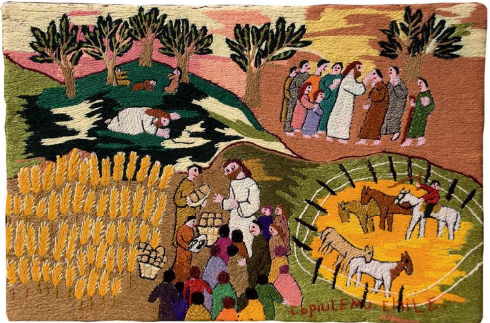
(Wandteppich) Hauptmotiv zum Weltgebetstag